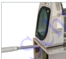
Präzise Längenjustierung der Elektrode.