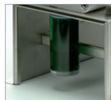
Geschlossener Staubfangbehälter zum Auffangen des Staubs und zur weiteren Entsorgung.