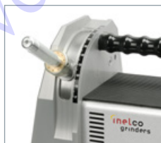
Schleifwinkel von 7,5-90° ermöglichen Spitzwinkel von 15-180°.