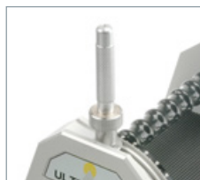
Die Spitze wird um 1/10 mm pro Punkt in der 90°-Position verkürzt.