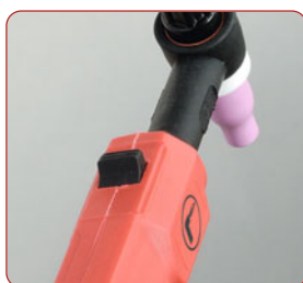
1 Doppeldruck (DD)