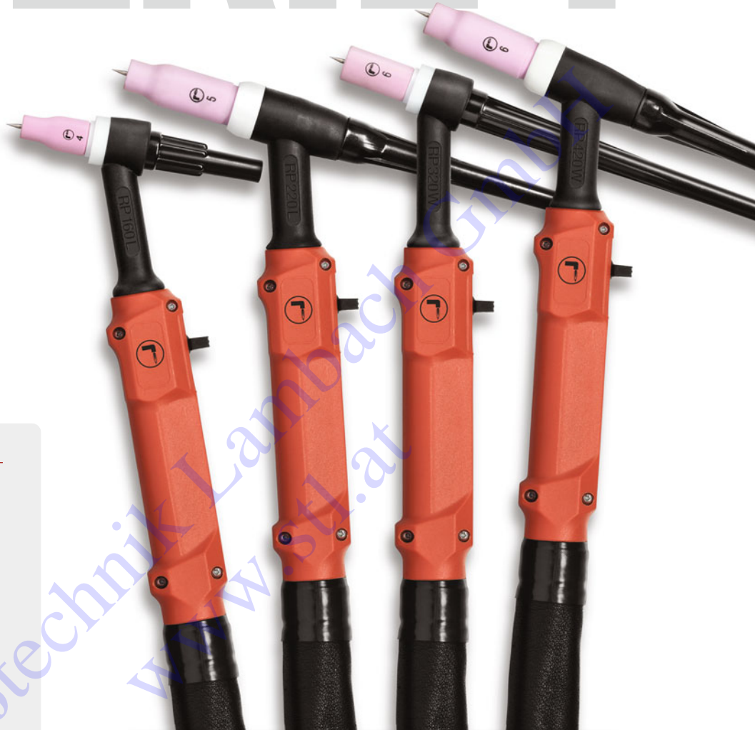
RP 160 L RP 220 L RP 320 W RP 420 W