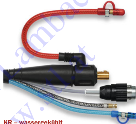
KR - wassergekühlt