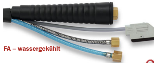
FA - wassergekühlt