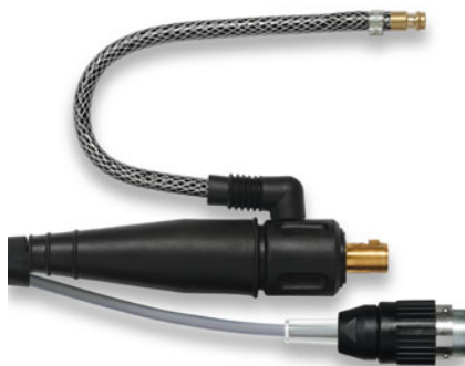
KR - luftgekühlt