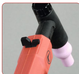
2 Doppeldruck und UpDown (DDUP)