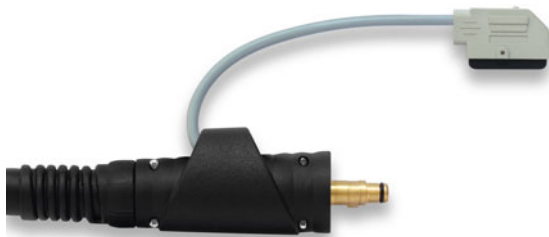
FE - luftgekühlt