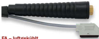
FA - luftgekühlt