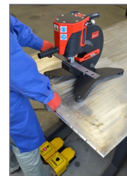
Tischständer mit Fußpedal