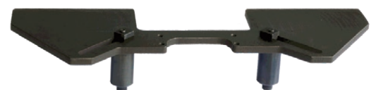
Optionale Führung für Rohre Ø 260-600 mm Produkt-Code: PRW-0461-22-00-00-0