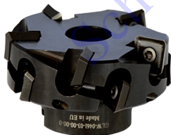
Monoblock-Fräskopf mit 10 Wendeschneidplatten befestigt mit Schrauben. Produkt-Code: GLW-0461-03-00-00-0