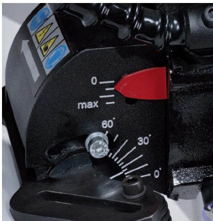
Kontinuierliche Winkeleinstellung von 0 bis 60 Grad.