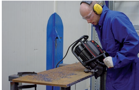
Anfasen von Platten