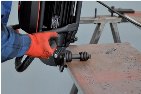
Plandrehen von Platten