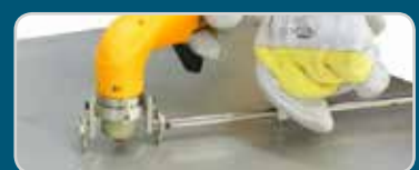
Kreisschneideinrichtung Circle cutting device