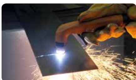
Manuelles Plasmaschneiden mit KjellCut 70 Manual plasma cutting with KjellCut 70

The plasma hand torch KjellCut 70 is used for cutting manually with the CutFire 65i. The user benefits from its ergonomic handle design and low weight. A switch-on protection prevents the unwanted ignition of the plasma arc and ensures safety. A large variety of accessories is available for the flexible use of KjellCut 70.