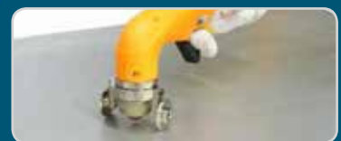
Räderwagen | Wheel guide