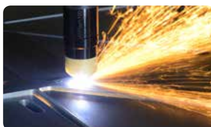
Mechanisieretes Plasmaschneiden mit Flash 100 Mechanised plasma cutting with Flash 100