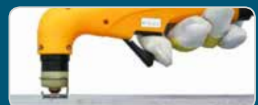
Distanzfeder | Spacer spring