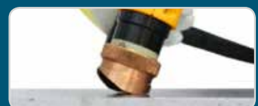
Fasenkronen | Bevelling cap