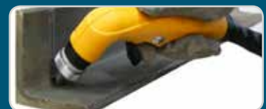
Lange Verschleißteile | Long consumables