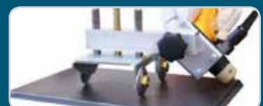
Fasenschneideinrichtung Bevel cutting device