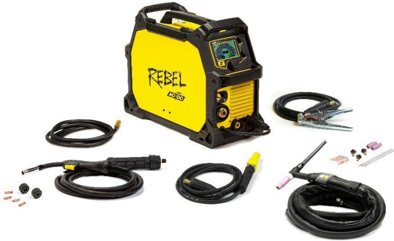
Rebel™ EMP 205ic AC/DC und Zubehör

Wir haben mit der ersten tragbaren Allprozessmaschine das Unmögliche möglich gemacht: Sie kann MIG, Fülldraht, E-HAND, DC WIG und nun auch AC WIG, das heißt – genau – sie kann Aluminium WIG-schweißen. Es handelt sich um ein ECHTES All-in-One-Schweißsystem, das bei jedem Prozess die beste Leistung in seiner Klasse liefert, und zwar in der tragbarsten und haltbarsten Ausführung, die es derzeit auf dem Markt gibt.